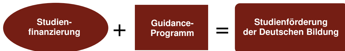
Abbildung 1: Komponenten der Studienförderungen

Die Studienförderung der Deutschen Bildung kombiniert eine flexible Studienfinanzierung mit inhaltlicher Unterstützung im Studium. Nicht nur finanziell, sondern auch inhaltlich werden motivierte Studierende aller Fachrichtungen an staatlich anerkannten Hochschulen unterstützt – unabhängig von der finanziellen Situation der Eltern.